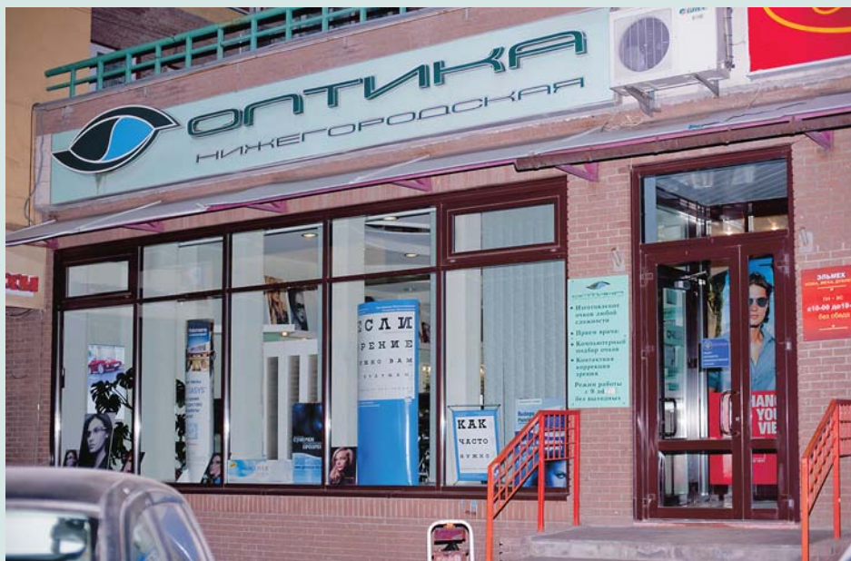
Салон расположен в самом центре Нижнего Новгорода, на Ошарской улице