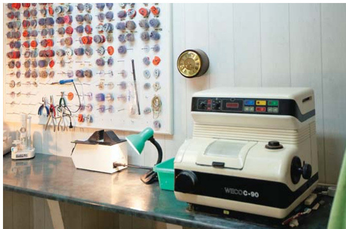
Очки изготавливаются на бесшаблонных станках марки Weeco