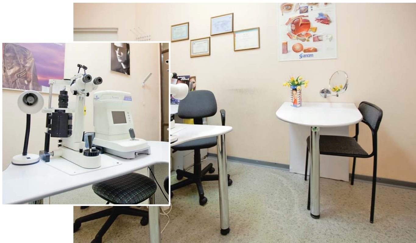
Кабинет врача оснащен современным оборудованием производства компаний Seiko и Shin-Nippon