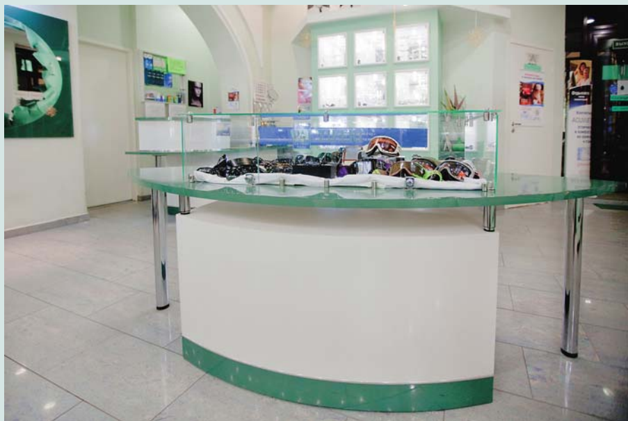
Отдельная витрина в центре предлагает вниманию клиентов солнцезащитные и спортивные очки

В салоне представлены коллекции оправ и солнцезащитных очков, а также очковые и контактные линзы от ведущих мировых производителей. Это салон высокого уровня, ориентированный на уважаемую публику, ищущую качественного обслуживания и оптимальной коррекции зрения, касается ли это оправ, линз или солнцезащитных очков. Целевая группа салона – это в основном люди среднего и старшего возрастов, те, кто ценит достижения оптической индустрии и проявляет интерес к передовым направлениям в области оптики.