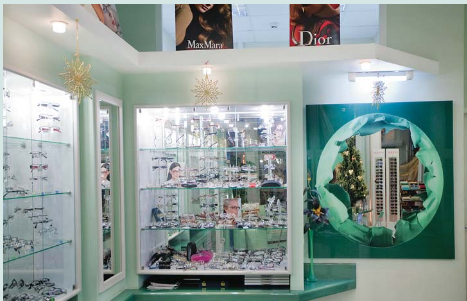
Обтекаемые формы стойки и части оборудования отлично гармонируют с зеркалом на потолке